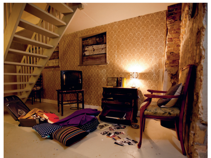
'Je wilt nog maar één ding: ontsnappen uit deze hel op aarde.'

In een gang loer je welwillend door de kijkgaten links en rechts. Een filmpje van een weg ergens in Afrika, omzoomd door vluchtelingen en militairen. Je werpt blikken op woeste jungles, huizen in puin, zeecontainers op schimmige industrieterreinen. Er groeit een licht onbehagen. Je krijgt