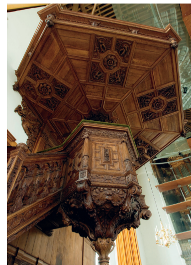
Een blik op de kansel