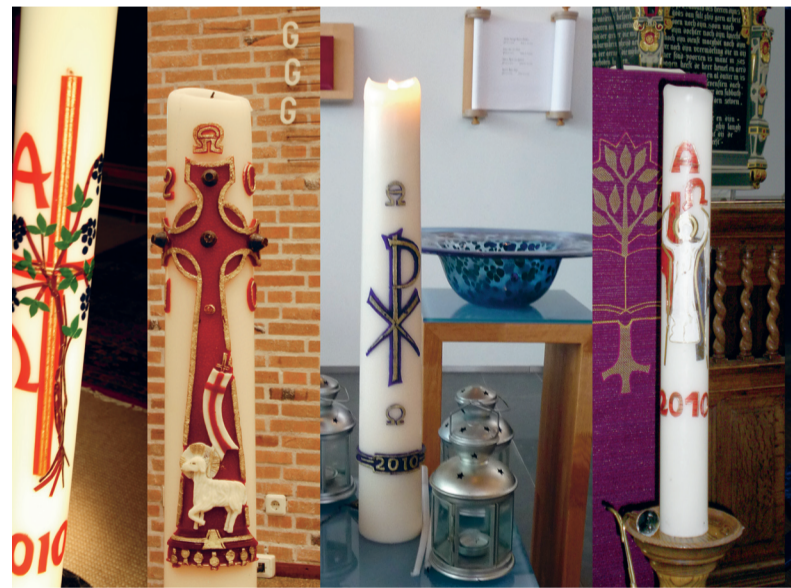
Verschillende overblijfselen van Haagse paaskaarsen. Met Pasen wordt in iedere kerk een mooie, nieuwe kaars aangestoken.