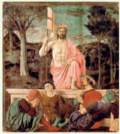
De Verrijzenis, Piero della Francesca

In dit nummer van KDH ruim aandacht voor Pasen, het feest van de opstanding en daarmee het belangrijkste feest van het christendom.