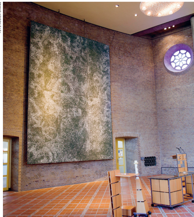
Het schilderij van Juliaan Andeweg.

In dit werk ga ik uit van de ronde vorm. Losse vormen schakel ik aan elkaar en laat ik ineenvloeien. Kleine autonome complexen ontstaan. Die kleine vormen hebben volledig recht van bestaan, ik vind ze interessant. Maar ze zijn ondergeschikt geworden aan de totale compositie, die door de schakeling ontstaan is. Ik kijk het liefst naar het geheel. Wie naar één detail kijkt, schrikt misschien. Maar wie naar het hele werk kijkt, ziet dat het zal transfigureren. Ik noem het