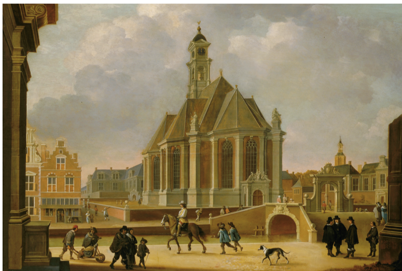
Gezicht op de Nieuwe Kerk, geschilderd door Barthold van Bassen.

De Nieuwe Kerk werd als 'centraalbouw' ontworpen, een vorm die in die tijd, en ook later nog wel, bij uitstek geschikt werd gevonden voor een protestantse kerk. De kansel staat daar in het midden, en alle gelovigen stonden of zaten er in een wijde kring om heen, om toch geen woord van de preek te hoeven missen. De bouw werd nodig geacht, omdat Den Haag in die jaren groeide, evenals de belangstelling voor het protestantisme. Overigens wordt de mythe weer eens doorgeprikt dat na de Tachtigjarige Oorlog de hele Republiek, van hoog tot laag,