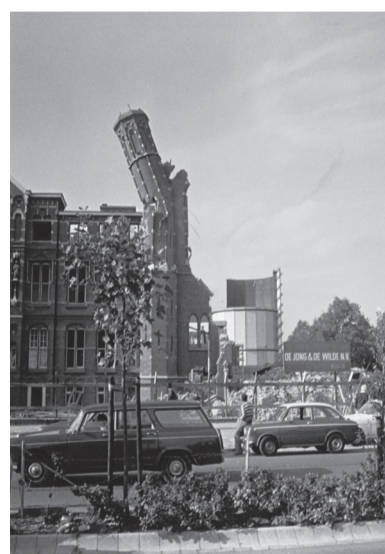
Afbraak van Groenestein

Koekoek wijdt interessante passages aan de werking van het geheugen, en aan de manier waarop kinderen tegen hun opvoeding aankijken. 'In een aantal gevallen lijkt het wel of kinderen van liefdeloze ouders of opvoeders, ten koste van alles toch van hen proberen te blijven