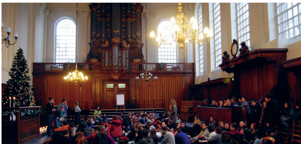
De Taizégangers die in Den Haag overnachtten, hadden ook een Haags programma. Zo was er een viering in de evangelisch lutherse kerk. Meer Taizé op pagina 2.