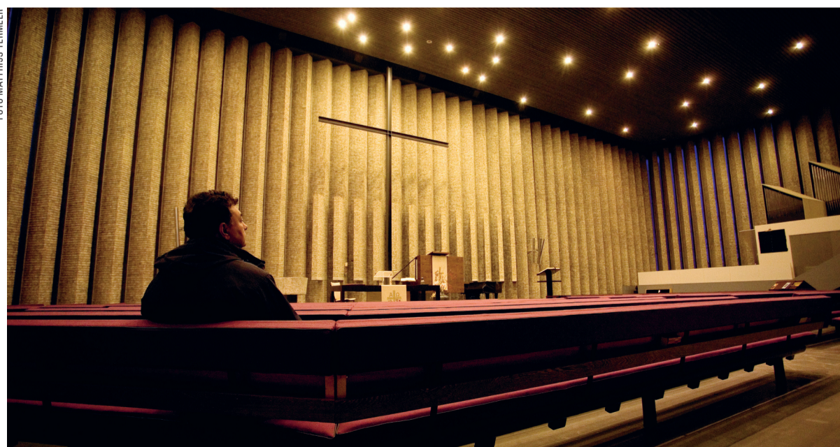
Babak: 'Ik ben vastbesloten om mijn geest sterker te maken.'