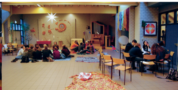
In groepjes gesprekken voeren.