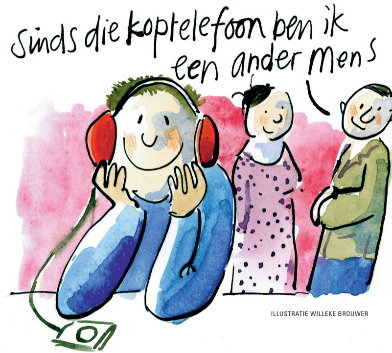
ILLUSTRATIE WILLEKE BROUWER

AGENDA De filosoof Charles Vergeer komt een avond naar De Boskant om te spreken over stilte. Hij schreef er een boek over: De kunst van de stilte . Een paar gedachten daaruit.