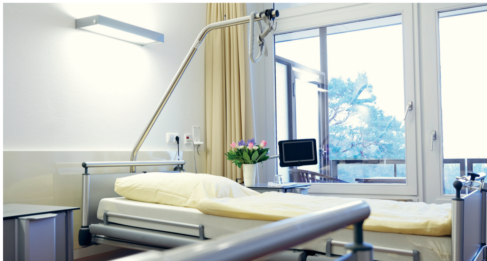
Geestelijke verzorging: meer dan aan het bed van patiënten zitten.