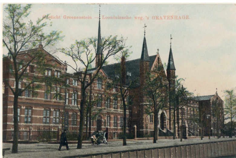
Groenestein in volle glorie aan de Loosduinseweg.

NIEUWS Veertig jaar geleden werd het grote Haagse rooms-katholieke weeshuis en opvoedingsgesticht Groenestein gesloopt. Het had, als gevolg van een barbaars regime, een slechte reputatie. Nog steeds doen gruwelverhalen de ronde.