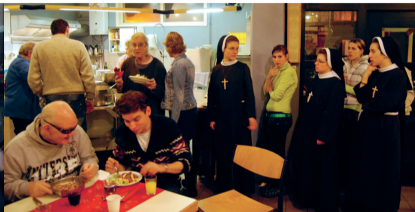
In de rij voor eten op Oudejaarsavond.