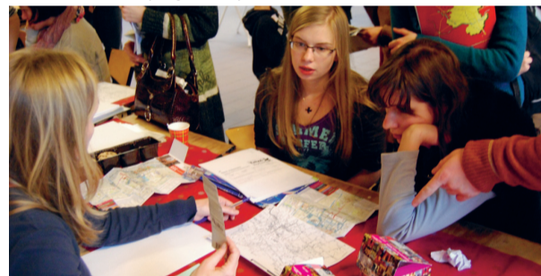
Uitleg van de strippenkaart.