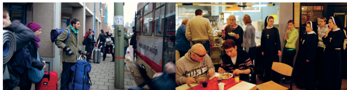
Aankomst van de jongeren bij de Lukaskerk.