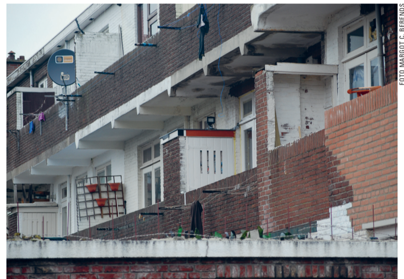
Armoede achter de voordeur in de wijk Rustenburg-Oostbroek.

Ook typerend voor deze wijk is de aan- wezigheid van eenzame, geïsoleerde ou- deren. 'Ze hebben een eigen woning, met alleen aow of aangevuld met een klein pensioentje. Maar ze durven de burens niet uit te nodigen, omdat ze geen geld hebben voor onderhoud van hun huis', weet Buist. Het project 'Jongeren voor ouderen' moet een einde maken aan dit isolement. De jongeren kunnen bood- schappen doen, de straat schoonmaken