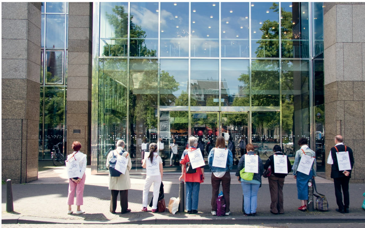
Iedere derde dinsdag (behalve in juli, augustus en september) om 13 uur is er op het Plein een stilte-actie tegen de armoede.