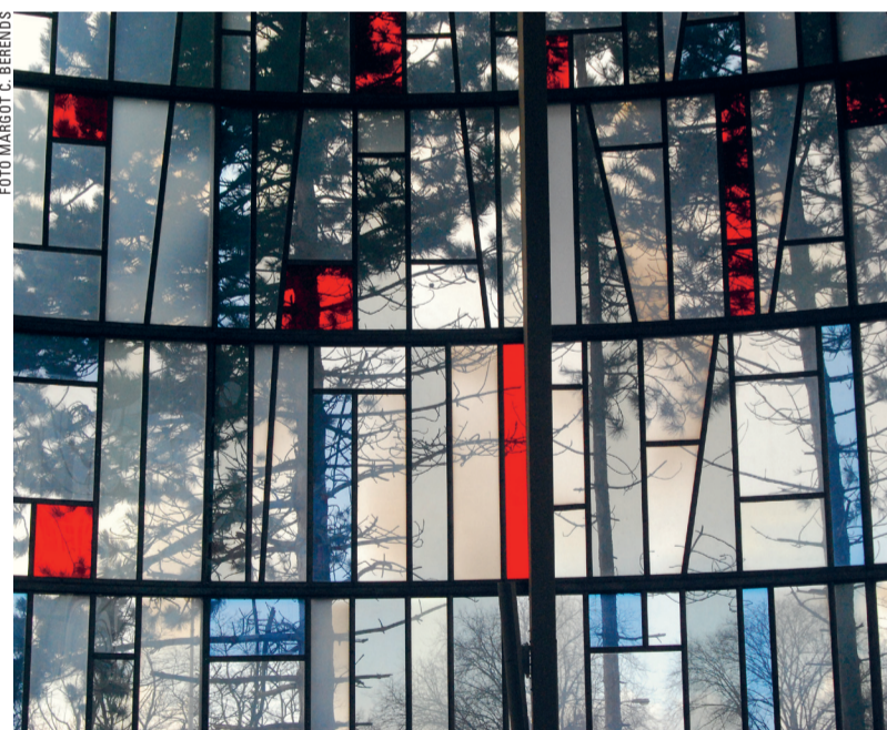
Glas-in-loodramen in de Amerikaanse kerk aan de Esther de Boer-van Rijklaan.

REPORTAGE De Amerikaanse protestantse kerk in Den Haag is in allerlei opzichten een smeltkroes. Er komen meer dan veertig nationaliteiten, en het ledenbestand wisselt voortdurend.