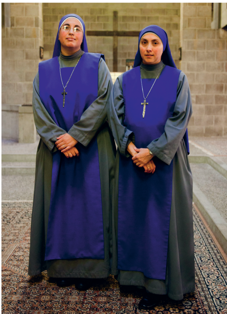
Blauwe Zusters Santa (links) en Verbo in De Straat. Langs de kerkruimte loopt 'De Straat', onder meer symbool voor de Via Dolorosa. Hier hangen ook de staties van het lijdensverhaal, in kleine relieffjes.

Zo helpt het blauw op straat de Blauwe Zusters om hun missie te vervullen: het terugbrengen van christelijke waarden in een ontchristelijkte samenleving. De zusters organiseren activiteiten voor parochianen, buurt en stad. Zo is er twee keer per maand een activiteit voor kinderen. Voor Sint Maarten maakten ze