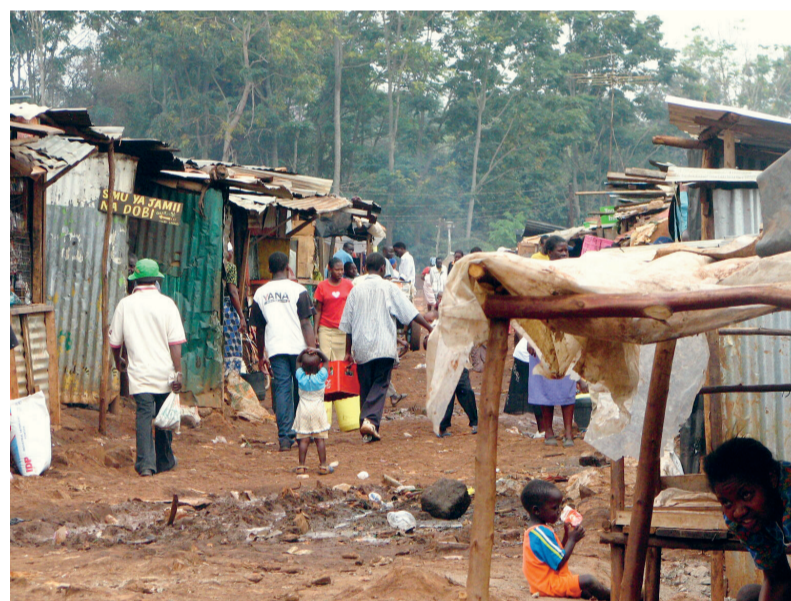
Een Keniaanse sloppenwijk.