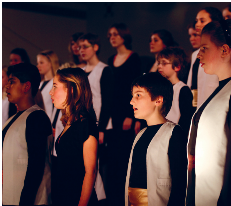
Een koor van de Kinderkoor Academie, Kerst vorig jaar.