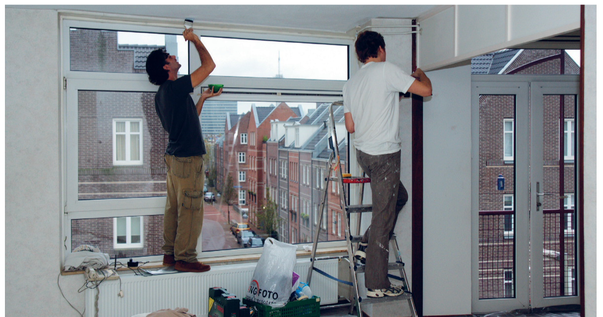
De vrijwilligers aan het werk. 'De behoefte om goed te doen voor je medemens blijkt bij velen in de genen te zitten.'