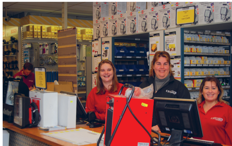
De drie 'Gerritse-angels' samen achter de toonbank van de ijzerhandel aan de Elandstraat.

De klant was van het type mens dat van welk uitgangspunt dan ook steevast bij de eigen interessantigheden weet te belanden. Naar aanleiding van het kapotte