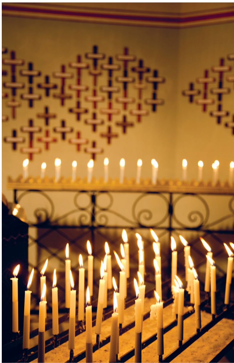
Een zee van lichtjes in de kerk van de H. Familie aan het Kamperfoelieplein.