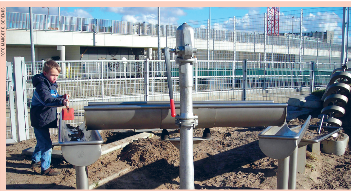
Kind in de stad De speeltuin van sport- en recreatiepark De Verademing, midden in de stad. Lekker scheppen, in een bizarre omgeving.