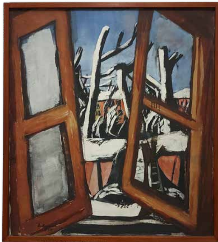
Max Beckmann, Winterlandschap

van de realiteit wil vangen, dat hij het onzichtbare zichtbaar wil maken door de realiteit te schilderen. ‘Beckmanns belangrijkste middel om dat te doen is de ruimte: “Het vertalen van hoogte, breedte en diepte naar het tweedimensionale vlak is voor mij de meest intense magische ervaring, waardoor ik een idee krijg van die vierde dimensie die ik met heel mijn ziel zoek.”’ Een ander paneel toont in grote letters een belangrijk citaat van Beckmann: ‘Ruimte – ruimte – en nog eens ruimte – de oneindige godheid die ons omringt en waarin wij zelf zijn. Dat probeer ik vorm te geven door te schilderen.’