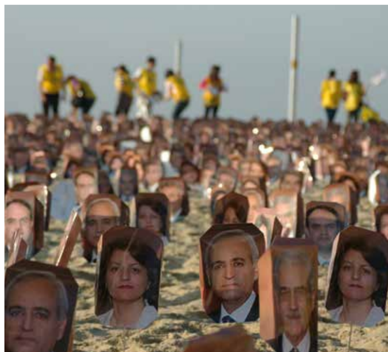
Campagne in Rio de Janeiro voor bahai-leiders die in Iran gevangenzitten.