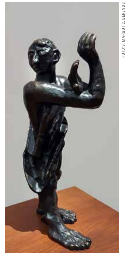
Max Beckmann, Man in het donker

In veel van zijn schilderijen zie je hoe hij die oneindige ruimte (van landschappen, uitzichten, de zee) inkaadert in de dichtbijge realiteit van bijvoorbeeld een venster, met alledaagse voorwerpen op de voorgrond. Twee werken illustreren op een mij aansprekende manier Beckmanns spiritualiteit. Het schilderij Winterlandschap toont schots en scheef hangende open ramen, met daarachter besneeuwde en onherstelbaar gekortwielde bomen. Het poogt, denk ik, de gebrokenheid van het bestaan te kunnen vatten in beschuttende ramen, die op hun beurt nooit meer kunnen sluiten. Verder de al genoemde sculptuur Man in het donker , die – volgens de