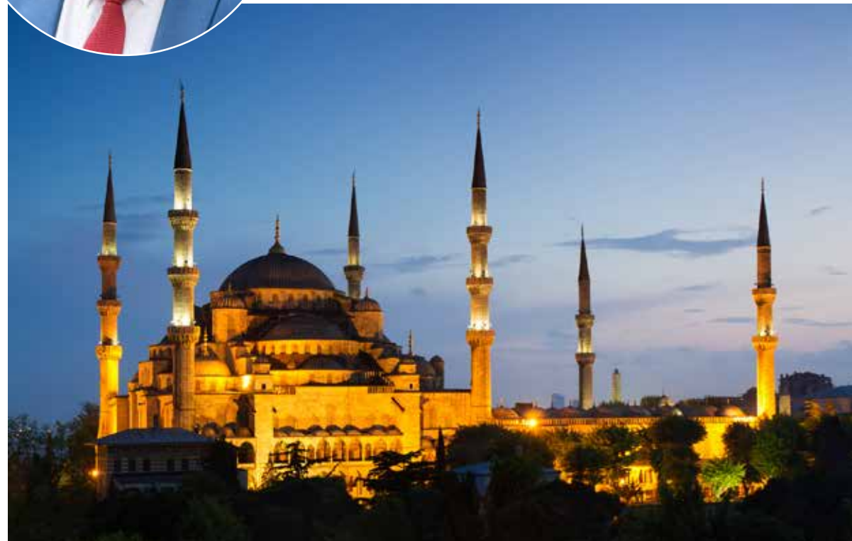
De Blauwe Moskee in Istanbul