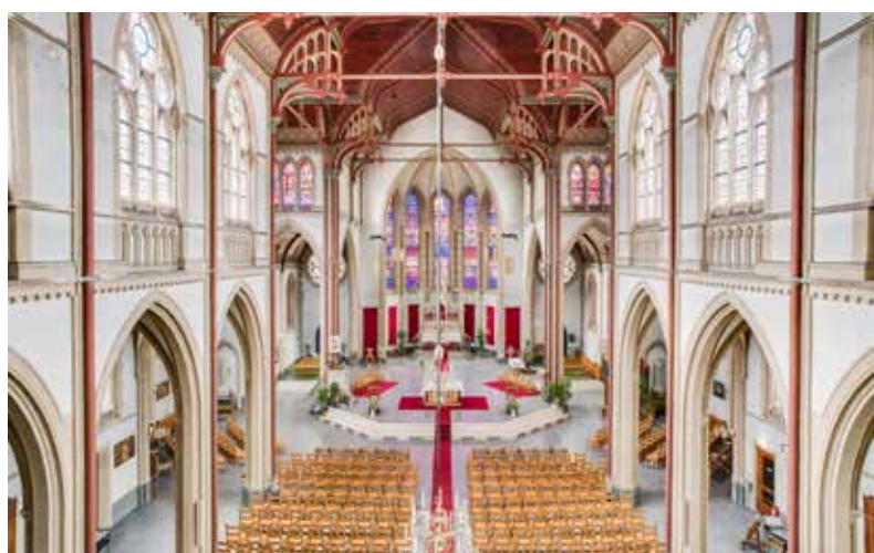
De Agneskerk is gemeentemonument.