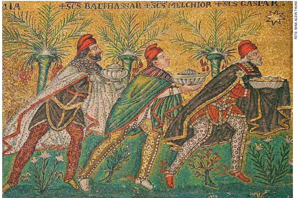
Mozaïek uit de zesde eeuw in de Basilica di Sant' Apollinare Nuovo in Ravenna, Italië.