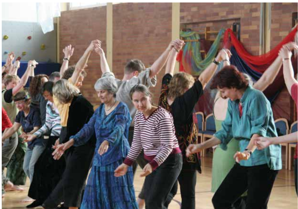
'Deelnemers komen in aanraking met hun spiritualiteit en gevoelens en brengen die tot uitdrukking.'

Dansend gebeurde er bij mij iets vergelijkbaars als in die meditatie, maar op een veel lichamelijker manier. Mijn lijf werd erbij betrokken, met huid en haar. Dansend breng je het verhaal tot uitdrukking, maar tegelijkertijd komen in je lichaam opgeslagen herinneringen en associaties aan het licht. Dat versterkt elkaar en geeft een betekenis die direct verbonden is aan je eigen leven. Je ontdekt iets over de tekst, maar je ontdekt tegelijkertijd iets over jezelf, over je leven en je geloof.'