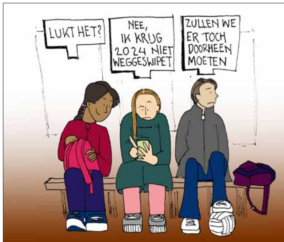
CARTOON: RONALD VAN BOCHHOVE