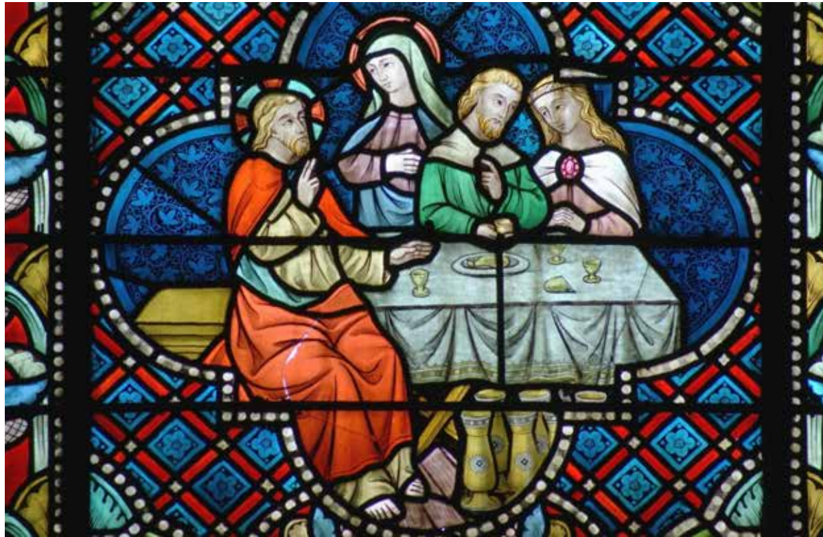
De bruiloft te Kana, gebrandschilderd raam in de St-Amanduskerk in Antwerpen.

Twee voorgenomen kerksluitingen bij parochie Maria Sterre der Zee