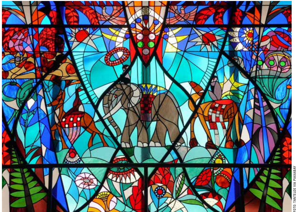
Gebrandschilderd raam in de Haagse Bijenkorf, in dit kader symbool voor de veelkleurigheid van de Haagse kerken.

Dan is een klankbordgroep toch wat te vrijblijvend. HUB is onder de paraplu van MARA gestart, maar wel met het idee dat de kerken zelf eigenaar worden. We hebben toen onze droom besproken over hoe verder te gaan en dat is de HUB-Raad geworden, bestaande uit een groep pastoren met verschillende culturele en theologische achtergronden. We dragen samen met de kerken onze visie uit. Het is een boeiende wereld met veel diversiteit en het helpt dat we elkaar steeds beter leren kennen. Het klinkt een beetje afgezaagd, maar het geheel is echt meer dan de som van de delen.' Een van de vrijwilligers die geïnterviewd wordt, heeft het desgevraagd ook over een droom. Zij wil voor de organisatie een eigen plek op een leuke locatie én dat HUB een nog serieuzere gesprekspartner wordt voor de