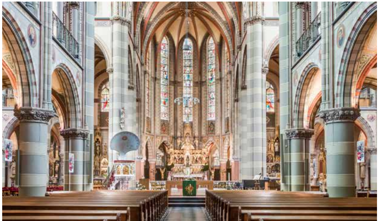
De Ignatiuskerk is een rijksmonument.

voren dat in deze twee gemeenschappen, meer dan in de andere, het aantal bezoekers en vrijwilligers terugloopt en dat daarin ook op langere termijn geen verbetering valt te verwachten. Er is nauwelijks opvolging en verjonging. Daarnaast is het pastoraal team inmiddels te klein geworden om zeven kerken goed te kunnen bedienen. Tot slot is er sprake van een stijging van kosten en een daling van inkomsten. Uit die optelsom konden