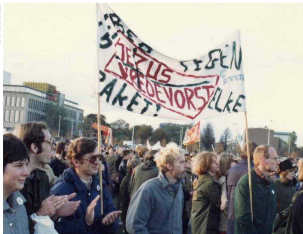
Demonstratie in 1983: ‘Jongens, achter Jezus aan!’

In grote gezelschappen, laat staan in een massameeting, voel ik mij niet thuis. Laat mij maar in een rustig hoekje met een oude kennis wat herinneringen ophalen. Het is niet uit angst voor een nat pak dat je mij niet op de A12 zult spotten. Ik krijg het gewoon benauwd tussen mensen die allemaal gelijk hebben. Omdat de (actie)boeren in groten getale kwamen, waren hun leuzen niet geloofwaardiger. En nu het om de fossiele subsidies gaat, regeert in een democratie ook niet de macht van de activisten. Uiteindelijk zullen mensen rond de (formatie)tafel een weg naar een beter klimaat moeten effenen.