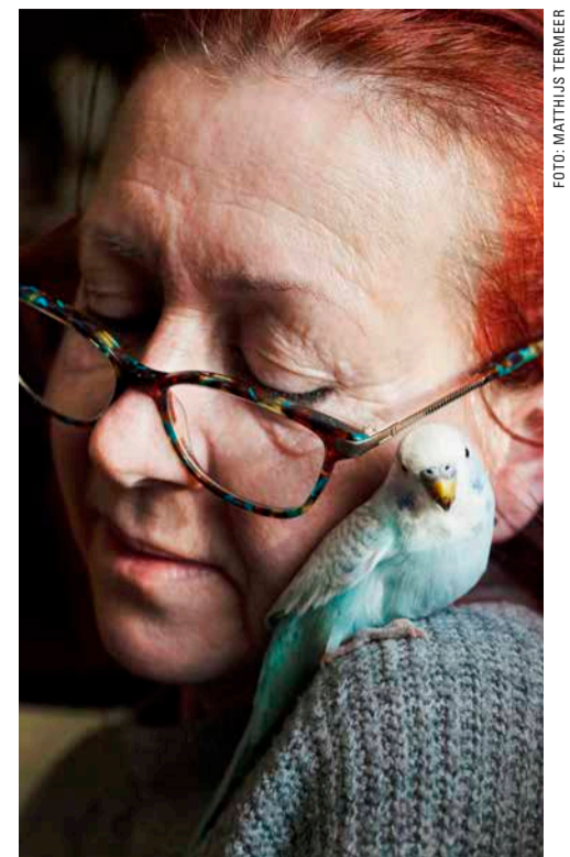
Het is meteen raak tussen de parkiet en de buurvrouw.

Ik koop een kooi voor Joepie, nogal klein. Uitgerust met horizontale spijlen, want een grasparkiet wil klimmen en klauteren. Ik installeer hem bij de buurvrouw en ga verder mijn eigen gang. De volgende dag breng ik een bezoekje. Joepie zit stilletjes in zijn kooitje, meestal met zijn rug naar haar toegekeerd. Haar gegil en gekir is verstomd. Wel piept en fluit de grasparkiet enthousiast bij het afspelen van een YouTube-filmpje met luidruchtige soortgenoten.