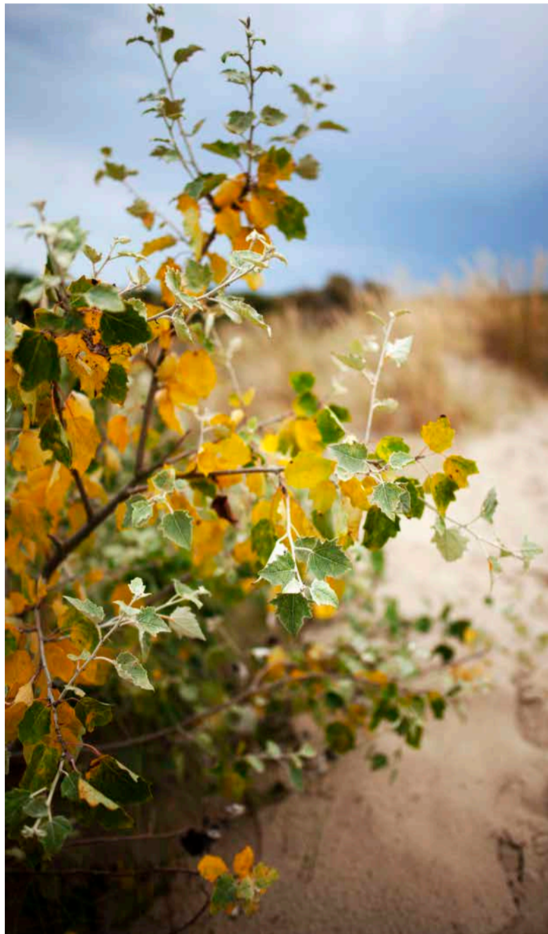
Herfst: meer dan verkleurende blaadjes.