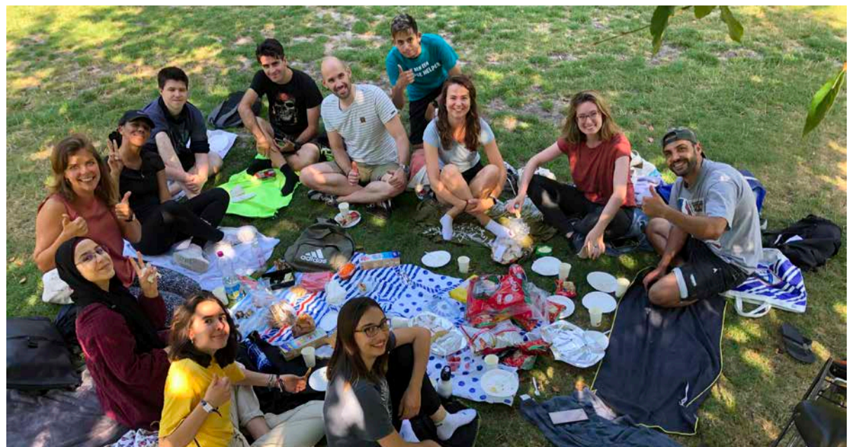
'Wanneer je samen met anderen vrijwilligerswerk doet, ontstaat er verbinding en saamhorigheid.'