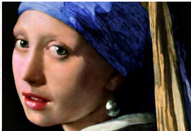
JOHANNES VERMEER