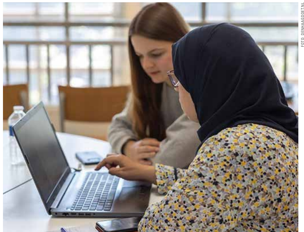
'We doen ons best om te helpen, bijvoorbeeld met een heraanvraag voor een voedselpakket.'

'Je moet wel stressbestendig zijn, want de problemen zijn soms onoverzichtelijk groot. Die zorgen moet je niet mee naar huis nemen en je moet ook niet te gauw opgeven. Je mag accepteren dat je soms niet kunt helpen. We werken in tweetallen, want er gebeuren altijd wel onverwachte dingen en dan is het prettig als je met een collega kunt overleggen. Eens in de twee maanden is er overleg met alle