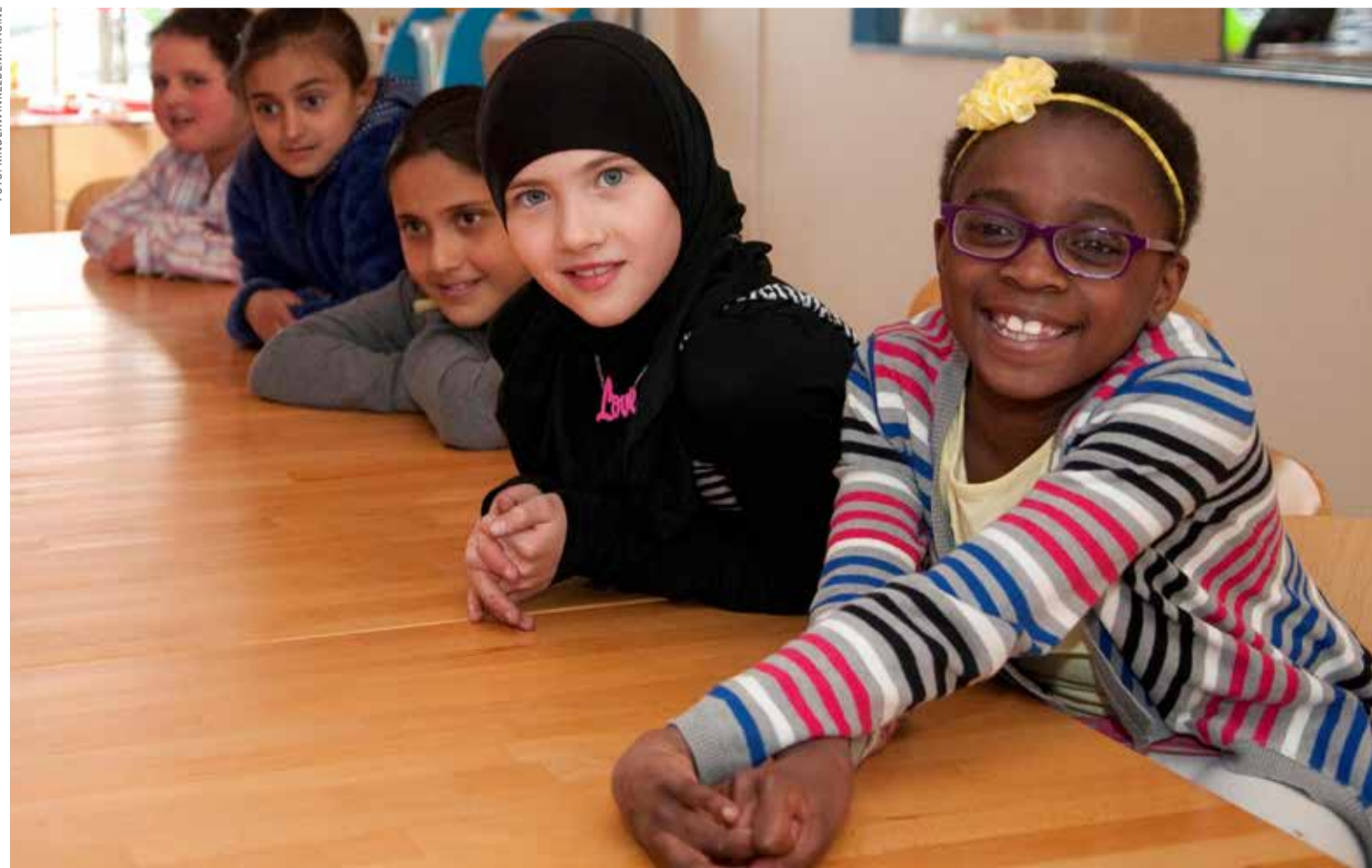
‘Op jezelf vertrouwen is nog belangrijker is dan het vertrouwen dat je van een ander krijgt.’