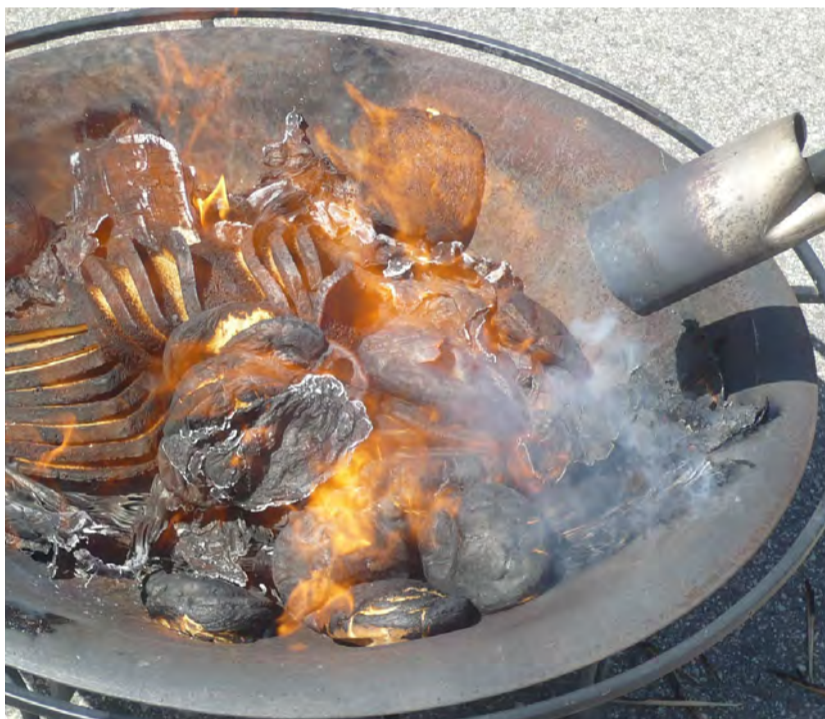
‘De ochtend voor Pesach begint wordt de chameets verbrand.’

‘Tegenwoordig hebben mensen grotere voorraden, zeker winkels. Daar is het volgende op gevonden: de chameets wordt weggestopt in een ruimte die op slot gaat. Deze wordt verhuurd aan een niet-joodse kennis en de spullen worden aan hem verkocht. Na Pesach kan hij deze weer terugverkoopen. Er is een Schevenings contract uit 1942 bewaard gebleven met een dergelijke afspraak. Het is een veelzeggend document: ondanks de