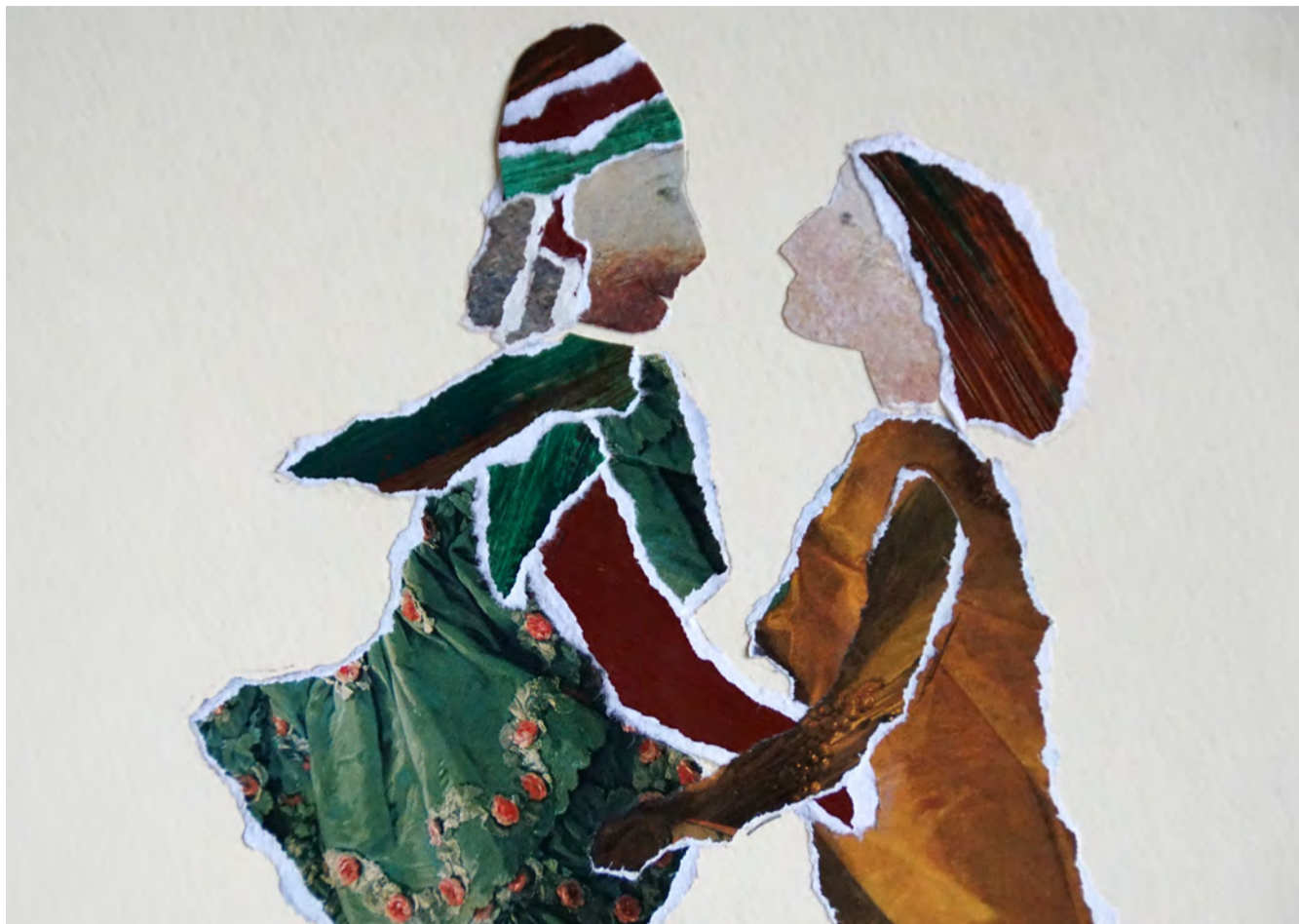
COLLAGE: JULY VAN DER VELDEN

Om te illustreren wat de betekenis van dit thema is in zijn eigen leven, vertelt Sniijders over een spontane ontmoeting op straat. Hij werkt als griffier in het centrum van Den Haag en op weg van kantoor naar huis werd hij ooit aangesproken door een dakloze. Of hij een euro kon missen. Er ontstond een gesprek