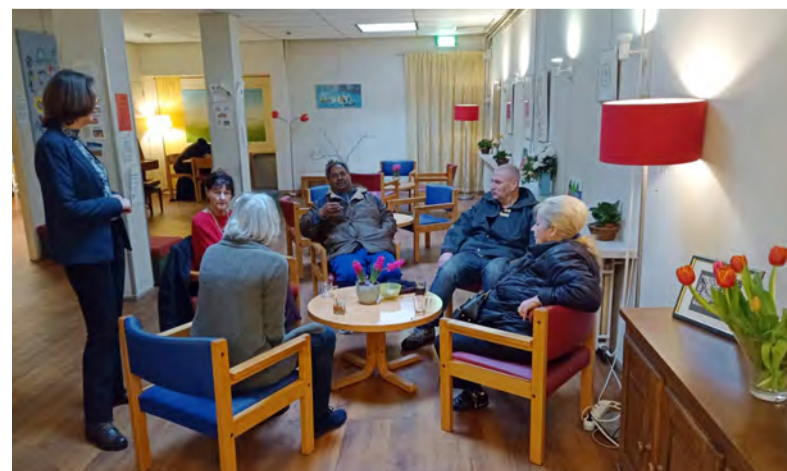
‘We vormen een gemeenschap met elkaar, vrijwilligers en bezoekers samen.’