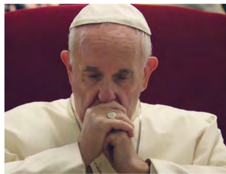
STILL UIT 'THE LETTER'