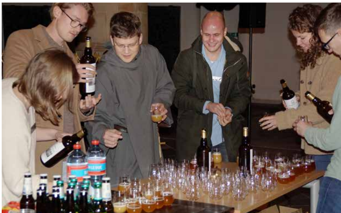
Als afsluiting een bierproeverij van de Haagsche Broeder: ‘Bier in grote flessen, om ruimhartig te kunnen delen.’

MEER INFORMATIE OVER LUX? ZIE LUXDENHAAG.NL